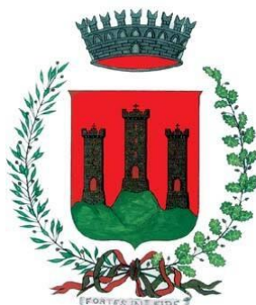
Comune Pieve Tesino