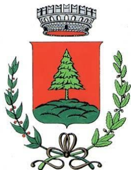
Comune Cinte Tesino