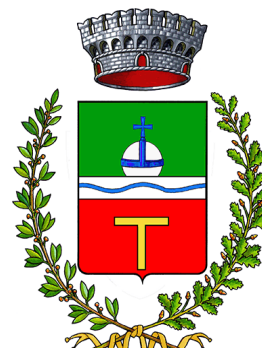
Comune Castello Tesino