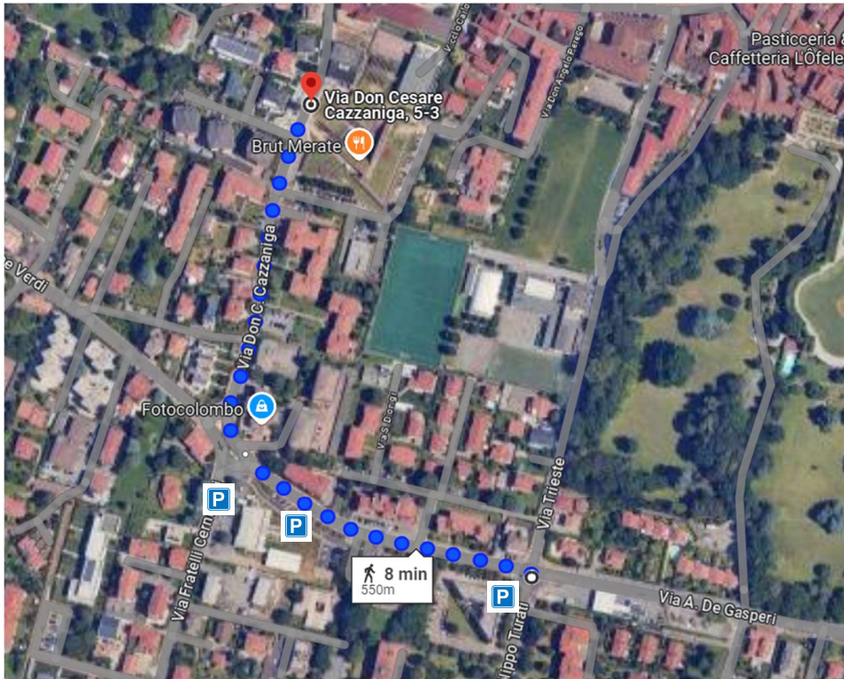
Figura 1 – Modalità di accesso al ritrovo lungo via Verdi. Con il simbolo P sono indicati i principali parcheggi.