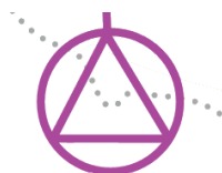
ripartenza dopo cambio carta