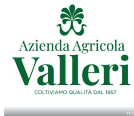
Azienda Agricola Valleri