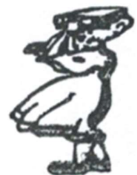
Libreria Dalla Mora