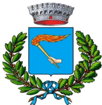
COMUNE di TIZZANO VAL PARMA