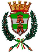
Città di Maniago Città delle coltellerie