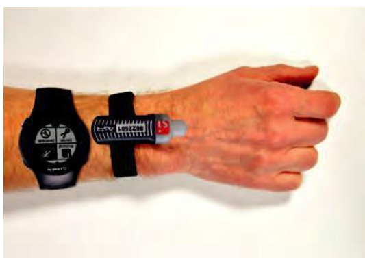
Immagine con esempio sbagliato: non indossare l'orologio GPS e la SIAC sullo stesso braccio.

La modalità AIR+ può essere compromessa da interferenze causate da altro equipaggiamento. L'antenna di alcuni orologi GPS può ridurre significativamente la sensibilità della SIAC. Come regola generale si consiglia di non indossare la SIAC e l'orologio GPS sullo stesso braccio.