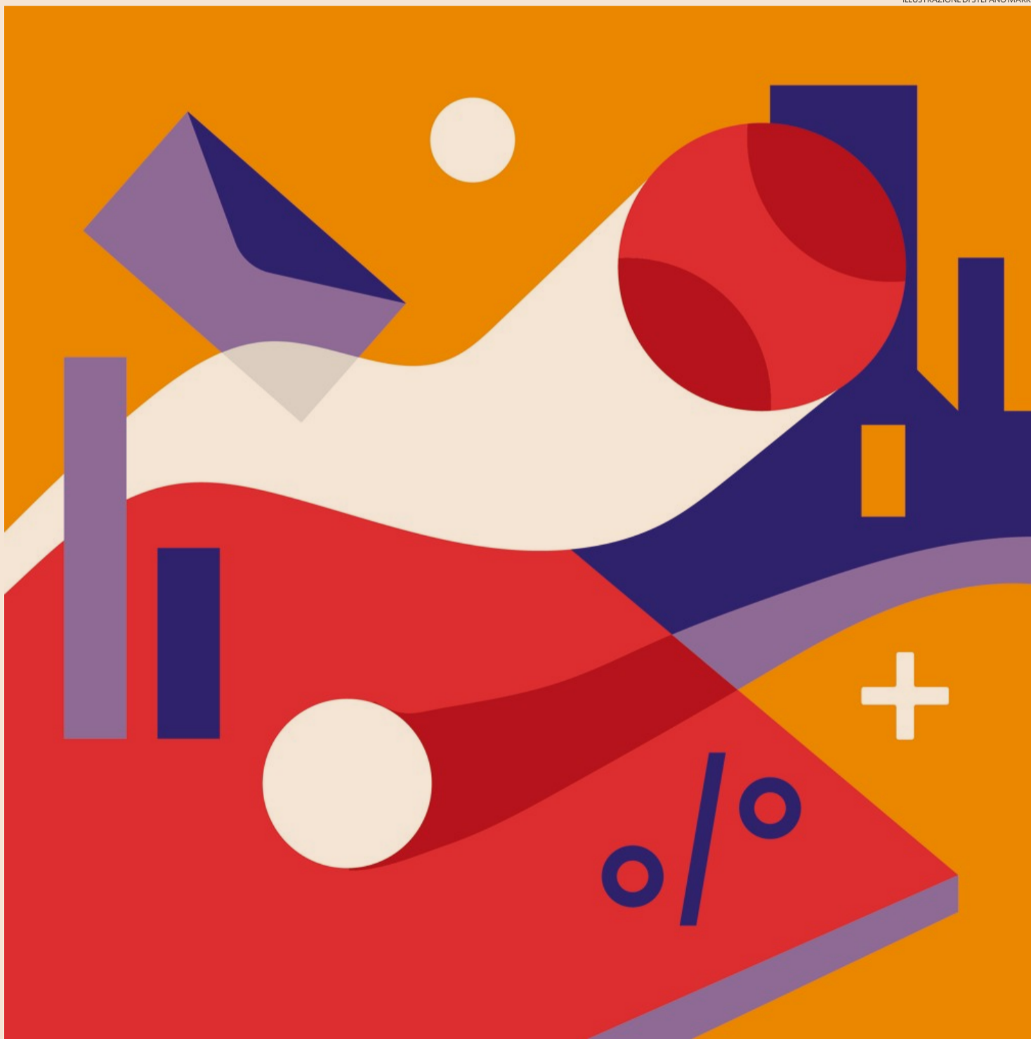
ILLUSTRAZIONE DI STEFANO MARRA