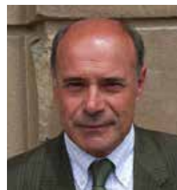
Angelo Francioni Sindaco di Carpegna (PU)