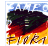
PARCO REGIONALE Campo dei Fiori