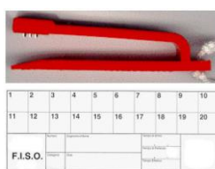
cartellino/testimone e punzone