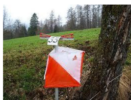
punto di controllo/lanterna

Il concorrente deve passare dal maggior numero di “punti di controllo” nel minor tempo possibile. La classifica viene stilata in base al numero di punti trovati, a parità di questi conta il minor tempo impiegato.