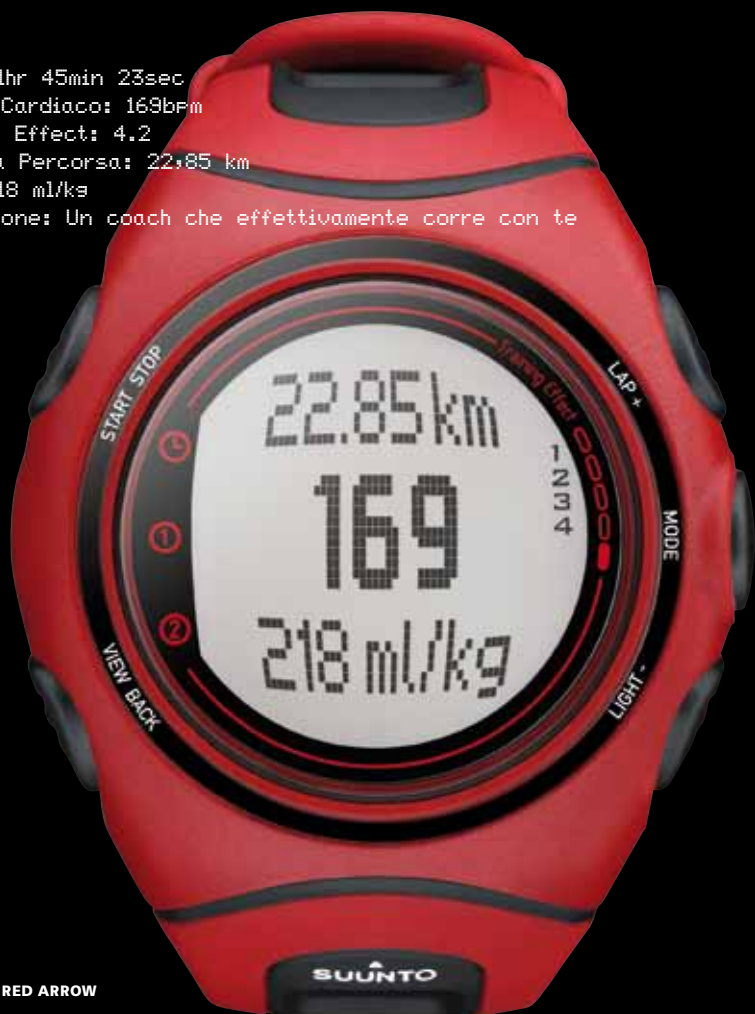
SUUNTO t6c RED ARROW

Tempo: 1hr 45min 23sec Battito Cardiaco: 169bpm Trainins Effect: 4.2 Distanza Percorsa: 22,85 km EPOC: 218 ml/kg Motivazione: Un coach che effettivamente corre con te