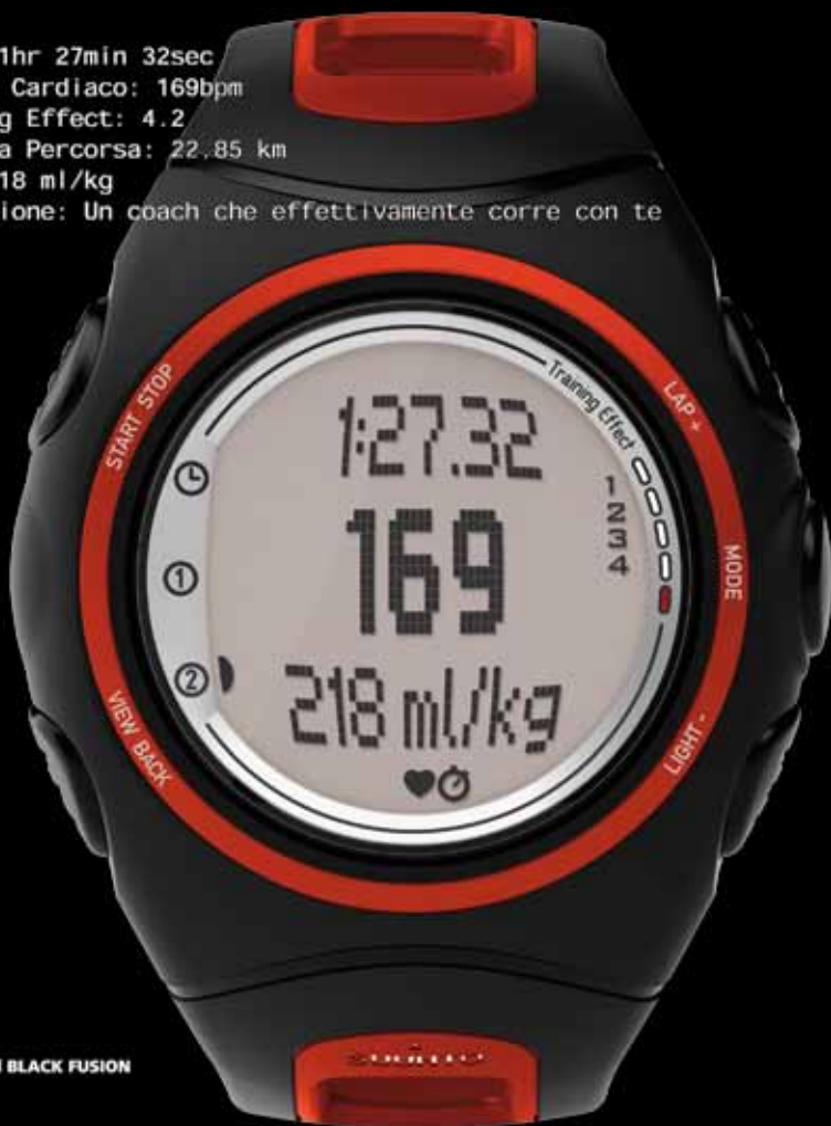
SUUNTO t6d BLACK FUSION

Tempo: 1hr 27min 32sec Battito Cardiaco: 169bpm Training Effect: 4.2 Distanza Percorsa: 22.85 km EPOC: 218 ml/kg Motivazione: Un coach che effettivamente corre con te