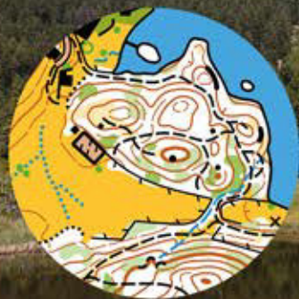
Map clip Italian Cup

Welcome to a new, unforgettable orienteering weekend in South Tyrol! On Saturday, 26th May an exciting middle distance orienteering competition valid as Italian Cup, organized by Sport Club Meran, will take place at Wolfsgruben. On Sunday the 3rd edition of the Relay of the Dolomites will be held at the foot of Mount Ritten Horn. A breath-taking view and a new, challenging terrain on 1700m a.s.l. are waiting for you!