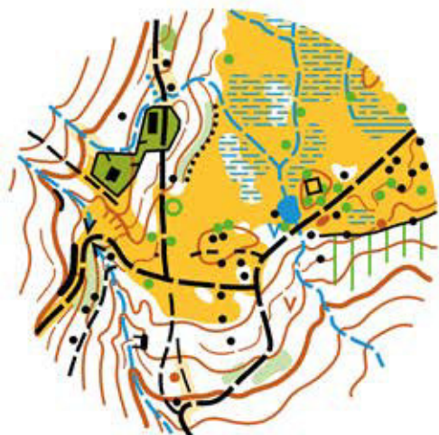
Map clip Relay