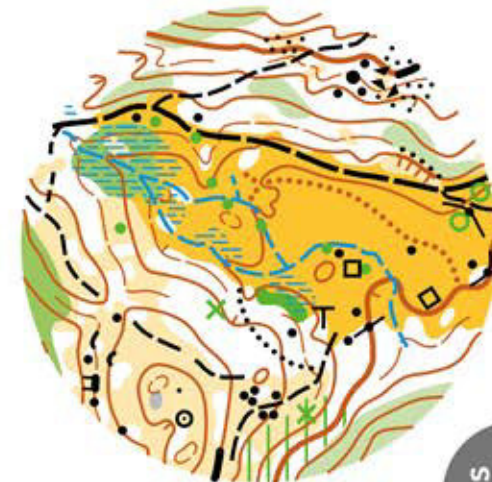
Map clip Relay